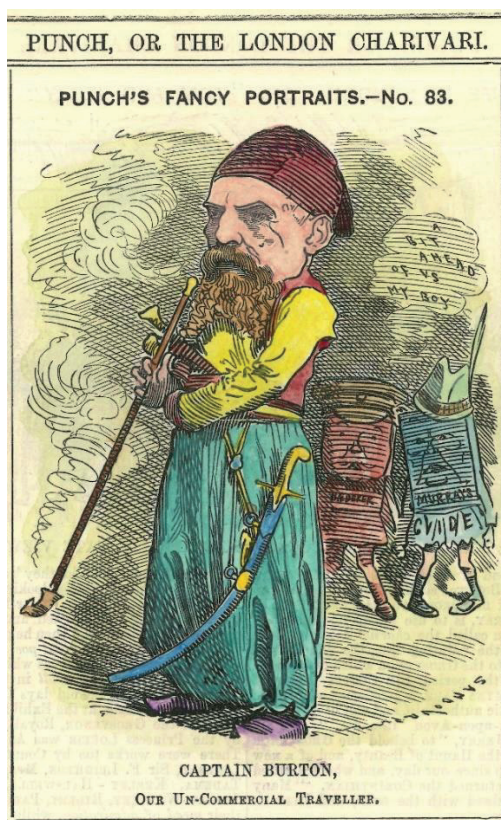
Figura 1. Captain Burton, Our Un-Commercial Traveller («Punch, or the London Chiarivari», May 13, 1882; Collezione privata, Pordenone)

Il 13 maggio 1882, sulla rivista Punch , il “charivari” londinese, appariva un ritratto-caricatura di Richard F. Burton in abiti orientali, intento a fumare oppio da una lunga pipa, mentre alle sue spalle due volumi antropomorfizzati lo osservano l'uno riferendo all'altro: «a bit ahead of us my boy» (fig. 1).