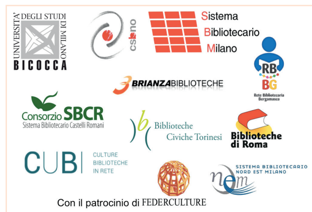
Figura 1 – Organizzazioni fondatrici di ISOB LAB

Partendo da queste premesse, è nata l'idea di costituire un osservatorio sui temi che riguardano l'innovazione e lo sviluppo organizzativo nelle biblioteche pubbliche. L'iniziativa, denominata ISOB LAB, Innovazione e sviluppo organizzativo per le biblioteche pubbliche, è stata resa possibile grazie allo stimolo propulsivo degli attori che andranno a comporre il comitato scientifico insieme all'università di Milano Bicocca: CSBNO