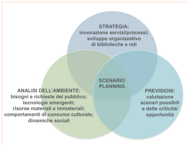
Figura 3 - Scenario planning per biblioteche e reti

lasciar andare le pratiche precedenti, neanche quando queste sono divenute obsolete e controproducenti. L'analisi degli scenari può essere applicata anche al mondo delle biblioteche. Le quali si trovano a operare, come ogni altra organizzazione, in un mondo di incessanti trasformazioni dovute alla rapida espansione della conoscenza, ai sempre nuovi sistemi di comunicazione che cambiano continuamente il modo in cui le persone accedono alle informazioni e alla testualità, e – non di meno – al continuo mutamento ed espansione della gamma dei bisogni delle persone. In un'epoca di trasformazione del ruolo della biblioteca, lo scenario planning rappresenta un metodo non certo nuovo ma sempre efficace per affrontare la complessità. Studi e analisi che gettano luce su quali siano le tendenze, le criticità ma anche le opportunità che le biblioteche possano aspettarsi di affrontare nel futuro. Ma che anche avvertono: i metodi tradizionali di pianificazione non sono più sufficienti, un nuovo orientamento nelle strategie di gestione della biblioteca è necessario.