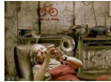
A Margherita Hack