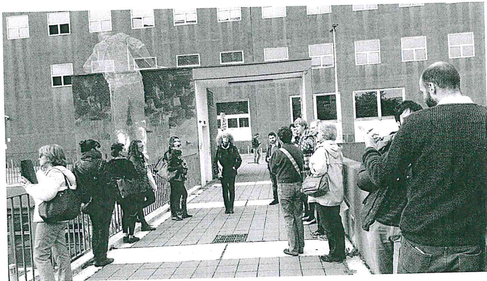
Passeggiando per i luoghi di Bicocca