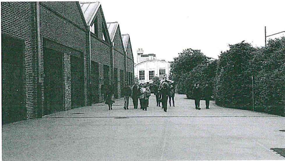
Verso Pirelli HangarBicocca