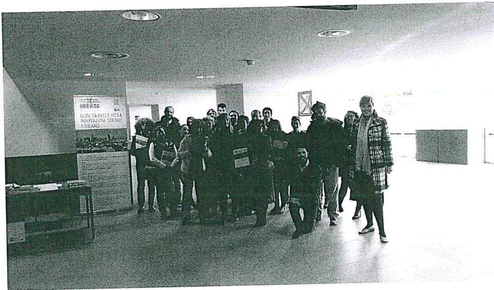
I partecipanti alle passeggiate