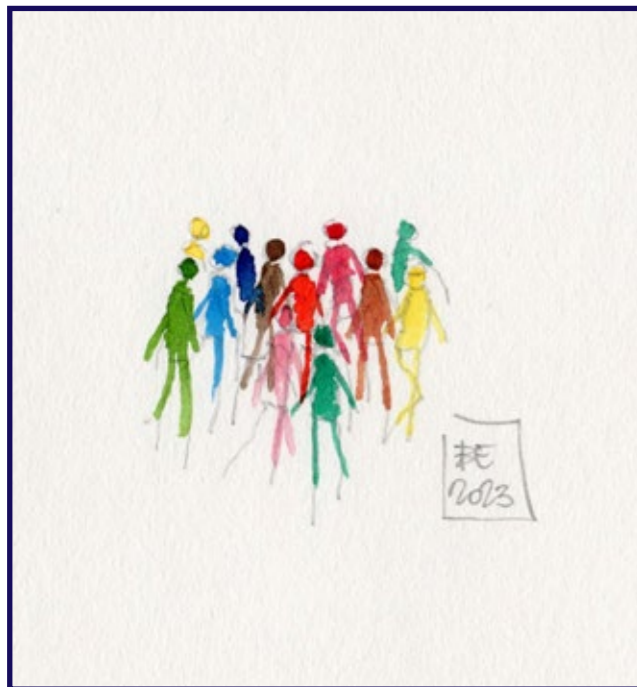
People are strange when you're stranger. Illustrazione realizzata da Eliano Biagioni

suto associativo, tassello che si costruisce attraverso la parola scritta e la lettura, attività che riveste un'importanza centrale nella mia vita e, credo, in quella di molti formatori.