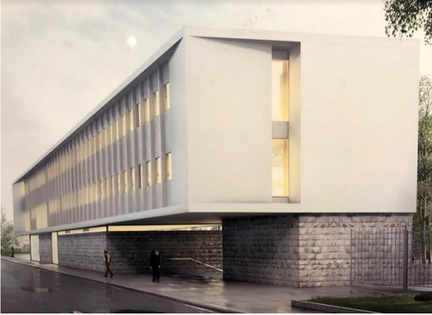
Dalla scuola diffusa al reclusorio architettonico

Quando invece il buon architetto (meglio il geometra meno “bobo” e radical chic? O il libero pensatore architettonico?) si fa solo interprete delle istanze della città anche in campo educativo diventa mentore per la collettività a prefigurare e costruire anche i luoghi della cultura e dell’educazione diffusa in un territorio non ne scaturiscono reclusori scolastici o opifici dell’istruzione. Gli archetipi suggeriti dall’idea di città e dall’idea di educazione divengono automaticamente mattoni di una costruzione quasi automatica, istintiva e poetica, esattamente come nel nostro meraviglioso medioevo.