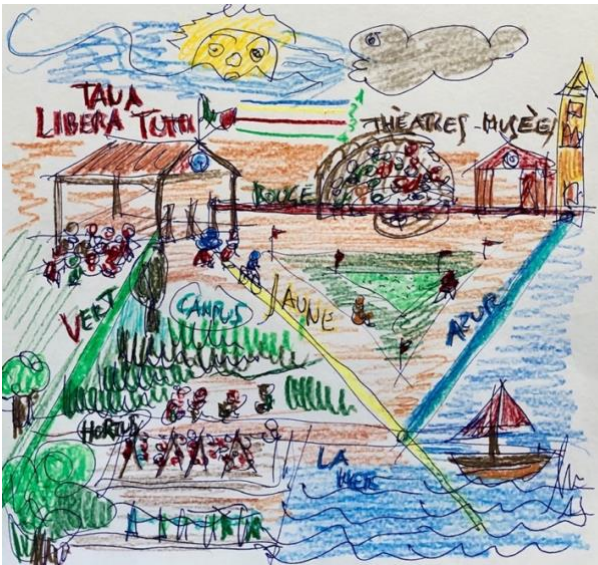
I fili di Arianna per la città educante